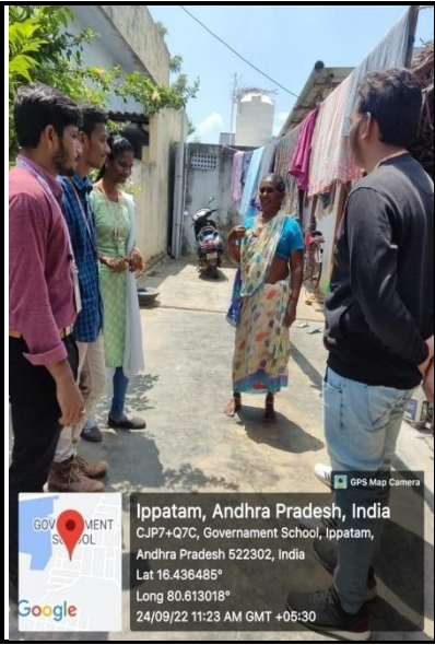
Ippatam, Andhra Pradesh, India CJ7+Q7C, Government School, Ippatam, Andhra Pradesh 522302, India Lat 16.436485° Long 80.613018° 24/09/22 11:23 AM GMT +05:30