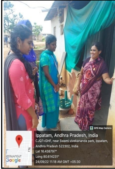
Ippatam, Andhra Pradesh, India CJQ7+GHF, near Swami vivekananda park, Ippatam, Andhra Pradesh 522302, India Lat 16.438797° Long 80.614231° 24/09/22 11:18 AM GMT +05:30